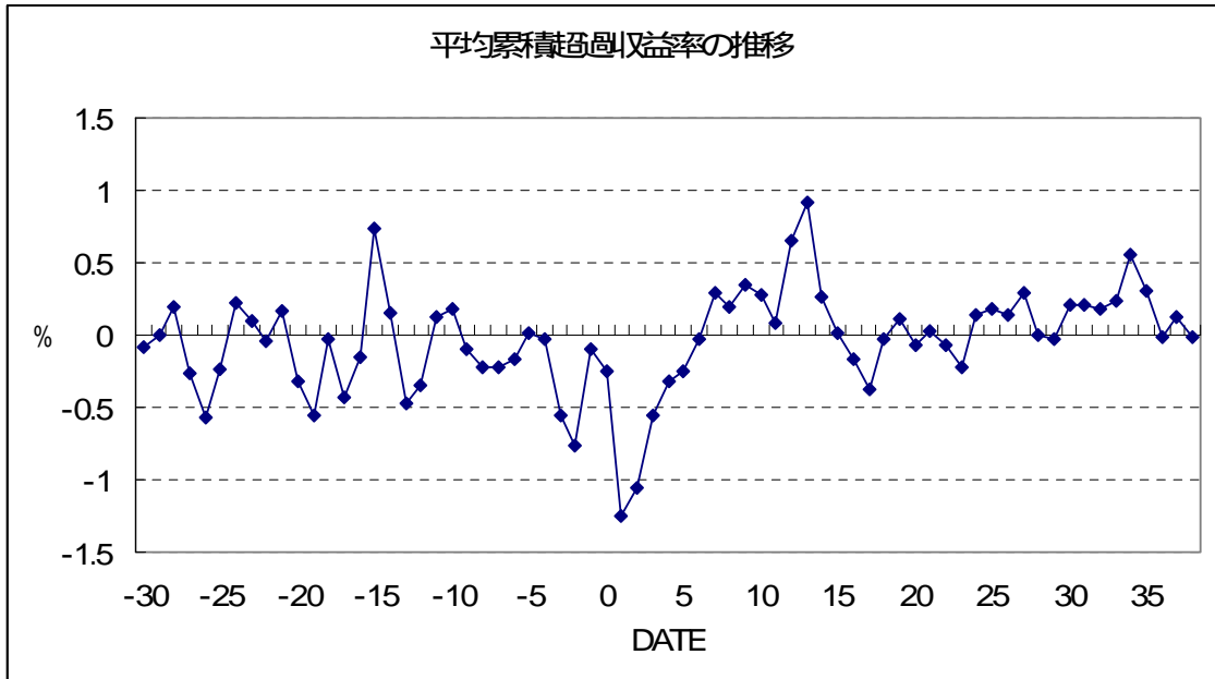
[図 1] 防衛策導入企業 99 社の平均累積超過収益率の推移